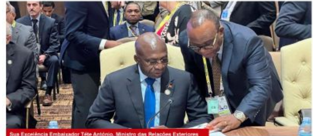
Sua Excelência Embaixador Tête António, Ministro das Relações Exteriores

A cidade de Kampala acolheu no dia 19 de Janeiro, a Cimeira dos Chefes de Estado e de Governo do Movimento dos Não-Alinhados (NAM).