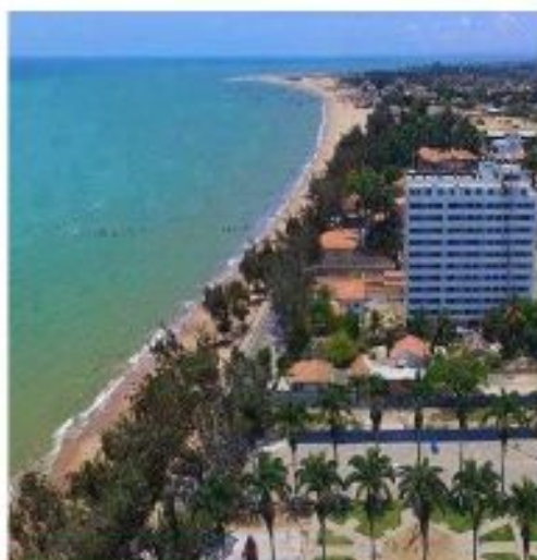
Visita parcial da cidade de Benguela, Angola

Foi igualmente Representante Permanente Adjunta de Portugal junto do Programa das Nações Unidas para o Ambiente (PNUA) e do Programa das Nações Unidas para os Assentamentos Humanos (UN-HABITAT) no mesmo país, entre outras responsabilidades no Ministério dos Negócios Estrangeiros de Portugal .