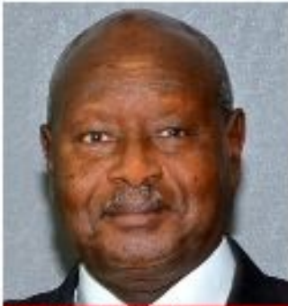
S.E Yoweri Kaguta Museveni Presidente da República do Uganda