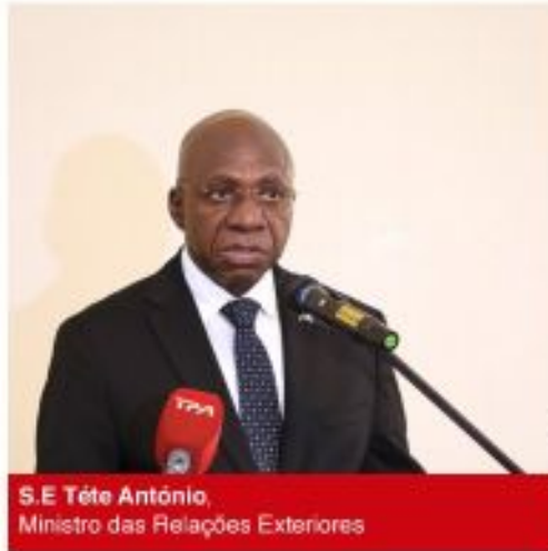
S.E. Tété António, Ministro das Relações Exteriores

A aposta pela melhoria das condições de trabalho e sociais, a capacitação dos recursos humanos e uma maior racionalização dos bens patrimoniais e financeiros constituem alguns dos principais desafios de gestão para o ano 2024, no Ministério das Relações Exteriores.