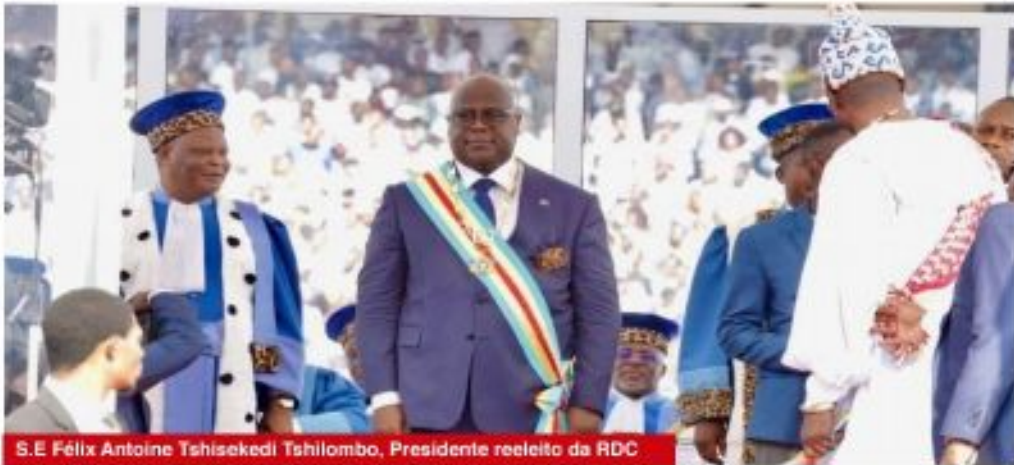
S.E Félix Antoine Tshisekedi Tshilombo, Presidente reeleito da RDC